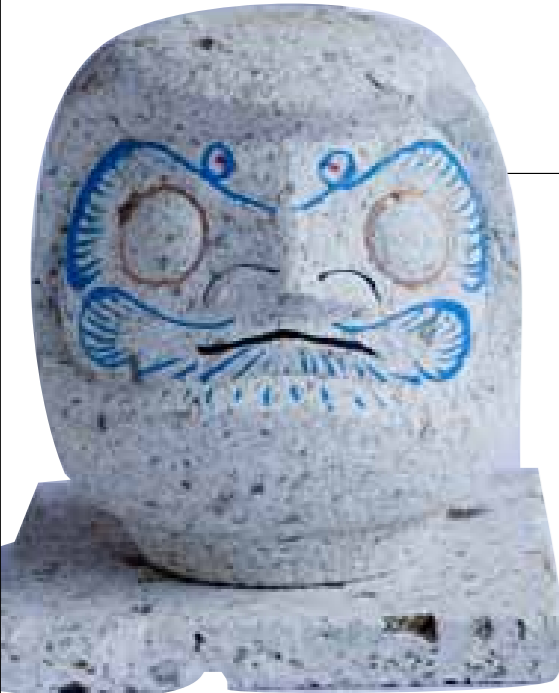
大谷石で造った贅沢なだるま。資料館隣接の「民芸かねいり」にて購入できる。