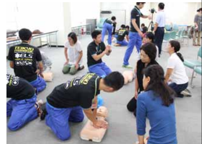
講習内容は、小児の心肺蘇生法、異物除去法、AEDの使用法など、4つのテーマで行われた。特に、AEDを用いた実技講習では、多くの質問があり、活気のある講習に。

救 急救命士をめざして、スキルや知識を向上させることを目的に活動する帝京大学板橋キャンパスのELS研究会(Emergency Life Support)。最近では、板橋区の子育て支援者養成講座内で、地域住民に向けて、実践的な子どもへの応急手当を指導した。学生たちは「指導する立場を経験することで、学習してきたことの理解が深まる」と語ってくれた。