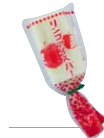
上 / まろやかなミルクの奥に、ほんのりとしたリンゴの甘酸っぱさを感じられる。左 / ファンの努力の結晶が形になった、リンゴアイスバー。