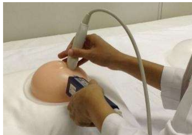
超音波ガイド下針生検の シュミレーションの様子